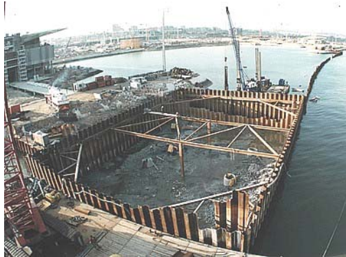
Ensecadeira da eclusa Lock cofferdam